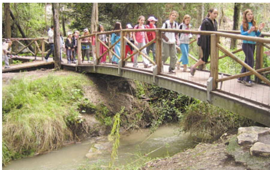
גשר בנחל השופט. למעלה: מראה כללי של עמק השלום

פ ארק רמת מנשה, השוכן מדרום לכרמל, בין יקנעם לקיבוץ גלעד, הוא מהאזורים היפים בארץ. המאפיין העיקרי שלו הוא שילוב של יערות, מרחבים פתוחים, שדות ומטעים, מעיינות ופלגים זורמים. הפארק, המשתרע על כ-84 אלף דונם, כולל את היערות, שמורות הטבע, שטחי החקלאות ושדות המרעה, וכן שישה יישובים כפריים. בעונות החורף והאביב מתקשטת רמת מנשה במרבדים של פריחות. עמק השלום, שבמרכז הפארק, מתכסה באלפי כלניות, נוריות, אירוסים, סחלבים ועוד. יער הרקפות שליד קיבוץ גלעד מושך אליו מטיילים רבים, ולאורך הנחלים הזורמים צומחים עצי ערבה מחודדת ושיחי פטל קדוש. איך מבטיחים את שמירת כל היופי הזה, לצד קיומם של היישובים הסמוכים, הקמת שכונות הרחבה, פיתוח עסקים תיירותיים ומקורות תעסוקה נוספים? התשובה: השמורה הביוספרית.