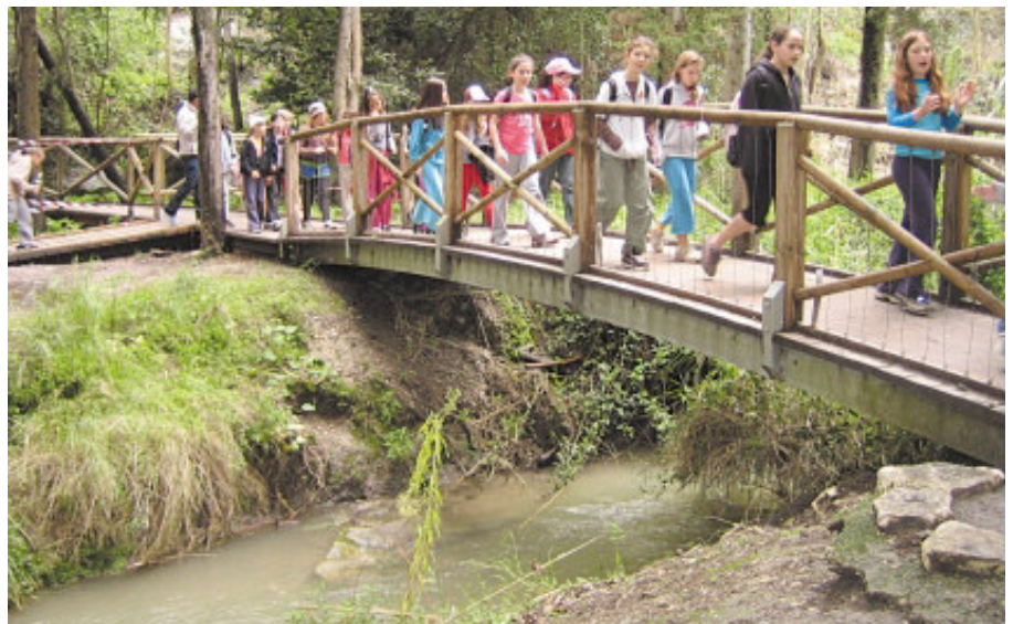
גשר בנחל השופט. למעלה: מראה כללי של עמק השלום

פ ארק רמת מנשה, השוכן מדרום לכרמל, בין יקנעם לקיבוץ גלעד, הוא מהאזורים היפים בארץ. המאפיין העיקרי שלו הוא שילוב של יערות, מרחבים פתוחים, שדות ומטעים, מעיינות ופלגים זורמים. הפארק, המשתרע על כ-84 אלף דונם, כולל את היערות, שמורות הטבע, שטחי החקלאות ושדות המרעה, וכן שישה יישובים כפריים. בעונות החורף והאביב מתקשטת רמת מנשה במרבדים של פריחות. עמק השלום, שבמרכז הפארק, מתכסה באלפי כלניות, נוריות, אירוסים, סחלבים ועוד. יער הרקפות שליד קיבוץ גלעד מושך אליו מטיילים רבים, ולאורך הנחלים הזורמים צומחים עצי ערבה מחודדת ושיחי פטל קדוש. איך מבטיחים את שמירת כל היופי הזה, לצד קיומם של היישובים הסמוכים, הקמת שכונות הרחבה, פיתוח עסקים תיירותיים ומקורות תעסוקה נוספים? התשובה: השמורה הביוספרית.